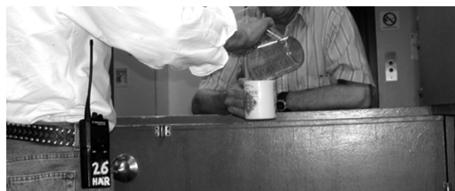
Programme de réduction des dommages chez les Bergers de l'espoir

L'étude conclut que l'expression « difficile à loger » devrait être bannie de notre vocabulaire puisque ces initiatives ont démontré que les sans-abri, même s'ils ont des besoins complexes et vivent dans la rue depuis longtemps, peuvent être logés avec succès dans un logement permanent lorsqu'on leur offre le soutien dont ils ont besoin et qu'ils veulent bien recevoir. Si des solutions ont pu être trouvées pour mettre fin à l'itinérance chez cette clientèle, alors les éléments clés qui différencient les organismes étudiés, tels que la priorité accordée au logement et l'approche centrée sur le client, peuvent être appliqués pour mettre fin à l'itinérance pour d'autres personnes qui n'ont pas d'endroit où vivre.