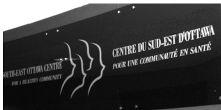
Services de prévention d'éviction au Centre du sud-est d'Ottawa pour une communauté en santé

Les familles et les individus peuvent perdre leur logement pour une multitude de raisons : réaction à de l'abus physique, perte d'emploi, ou revenu ne permettant pas d'occuper un logement convenable. Certains individus sont à risque dû à une maladie mentale, une consommation abusive d'alcools et autres drogues, l'absence d'aptitudes à la vie quotidienne ou l'incapacité de vivre seul.