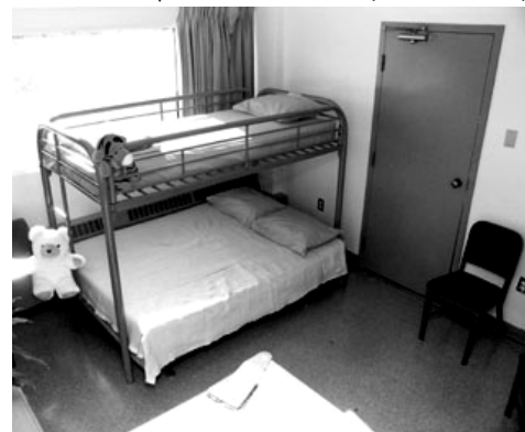
Chambre d'un refuge pouvant accueillir une famille, Ville d'Ottawa

Pour obtenir de l'aide (autre qu'une ambulance) pour une personne dans la rue (Ville d'Ottawa)