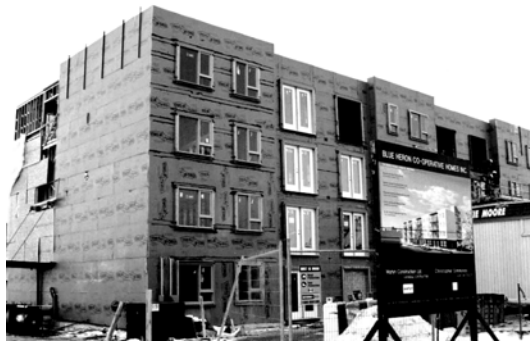
La Blue Heron Co-op, la première en 10 ans, accueille une population à revenu mixte dans l'Ouest de la ville.