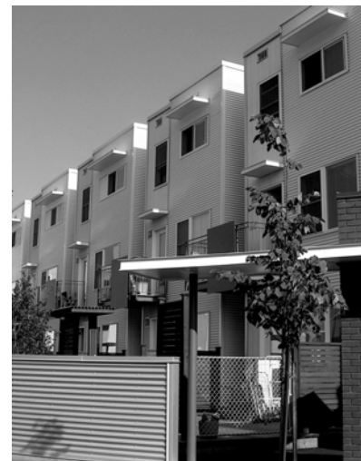
Le projet d'habitation de la CCOC sur Richmond Road qui s'est mérité un prix en 2005

Cette initiative de densification, qui a connu du succès dans d'autres villes canadiennes, pourrait permettre la création de 208 000 unités d'habitation dans la région urbaine d'Ottawa.