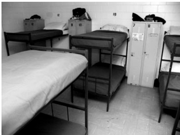
Une salle d'hommes à l'Armée du salut