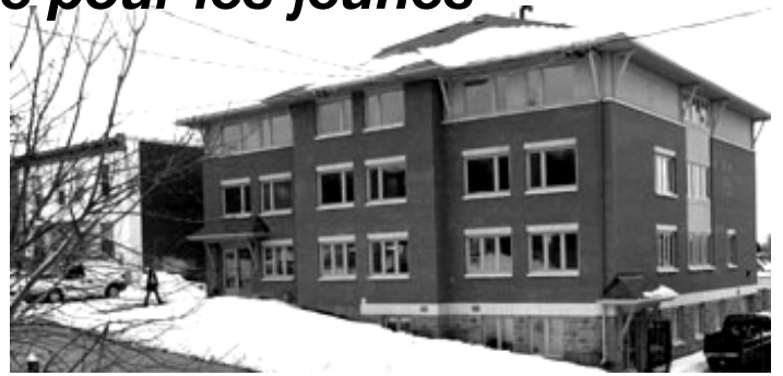
Le nouveau centre d'hébergement pour jeunes femmes ouvrira ce printemps

Depuis dix ans, deux refuges accueillent les jeunes dans la ville d'Ottawa : le refuge pour jeunes femmes du Bureau des services à la jeunesse (BSJ) et le refuge pour jeunes hommes administré par l'Armée du Salut. Les jeunes de 12 à 20 ans y trouvent un refuge d'urgence à court terme, de même qu'une multitude de services, dont ceux de counseling et de représentation.